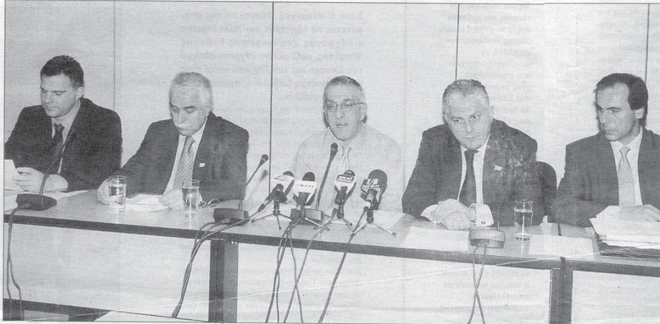
Με τέσσερα καταλυτικά μέτρα που ανακοινώσε χθες ο υπουργός Ν. Κελαϊμάνης θα επικεντρωθεί στην «εξυγιάνωση» του πολύπαθου χώρου της Υγείας

Η πρόσληψη 5.980 ατόμων στο χώρο της Υγείας μέσα στο 2004, η καθιέρωση της Ευρωπαϊκής Κάρτας Υγείας για τους Ευρωπαίους πολίτες για πρώτη φορά σε πιλοτικό πρόγραμμα στην Ελλάδα κατά τη διάρκεια των Ολυμπιακών Αγώνων, η δημιουργία Κέντρων Εξυπηρέτησης και Ενημέρωσης Πολιτών στο χώρο της Υγείας και η απόφαση του υπουργείου Υγείας και Κοινωνικής Αλληλεγγύης να πατάξει τη διαφθορά στο χώρο της Υγείας ήταν τα βασικά σημεία τα οποία επεσήμανε σε χθεσινή συνέντευξη Τύπου ο υπουργός Υγείας και Κοινωνικής Αλληλεγγύης Νικόλαος Κελαϊμάνης.